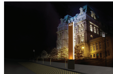
Le Taxi Prend Ses Aires, Montréal, Canada