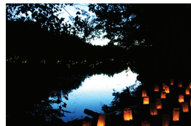
Installation la foret des lanternes, Leppa, Finlande