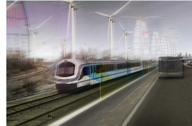
Lauréat concours int. YUL-MTL, Montréal, Canada