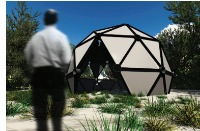
Proposition pour les Jardins de Métis, Canada